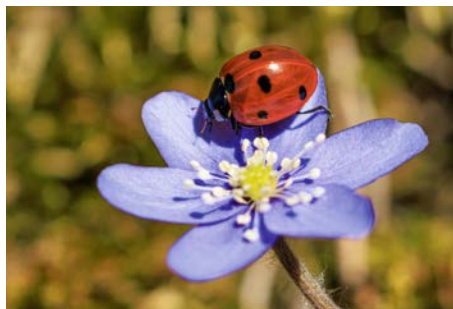
FRÜHLINGSBOTEN IM DONAUTAL.

Auch die wärmeren Temperaturen im Frühling können sich positiv auf unsere Gesundheit auswirken. Sie regen uns dazu an, mehr Zeit im Freien zu verbringen, Sport zu treiben und uns generell aktiver zu bewegen. Dies trägt nicht nur zur körperlichen Fitness bei, sondern kann auch Stress reduzieren und das allgemeine Wohlbefinden